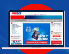
Sitio Web www.bancobcr.com