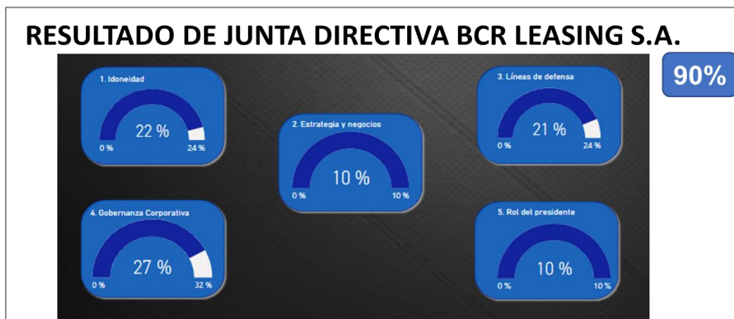
Imagen n.º3. Resultado de Junta Directiva BCR Leasing S.A.

Con respecto a las oportunidades de mejora, es importante recalcar que el área (la Oficina) de Gobierno (Corporativo) se reunió con la Gerencia de BCR Leasing y también con (la Gerencia Corporativa de) Capital Humano para atender estas oportunidades de mejora.