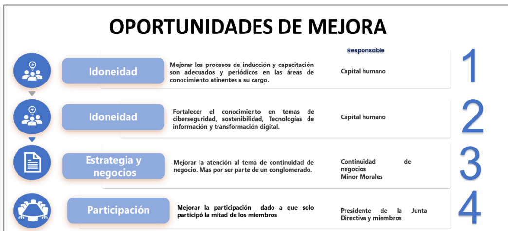
Imagen n.º 4. Oportunidades de mejora